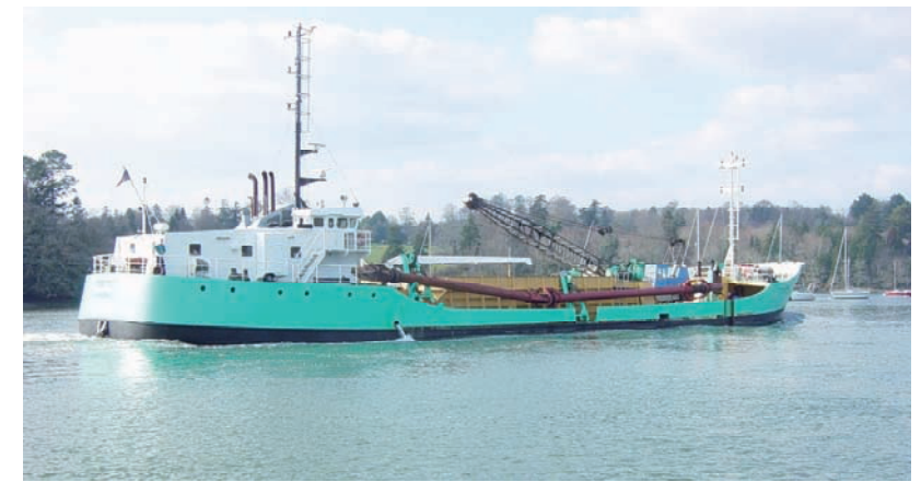
SABLIERS DE L'ODET