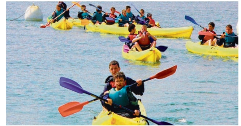
CANOËS SUR L'ODET